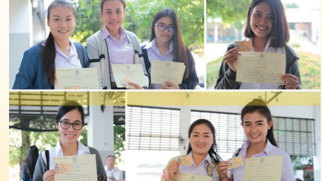
ว่าที่แม่พิมพ์พร้อมตัวห้องเจ้ารับใบประกอบวิชาชีพครู กว่า ๔๐๐ คน

นักศึกษาครูศาสตร์บัณฑิต รหัส ๕๕ และค่าชั้น มหาวิทยาลัยราชภัฏเชียงใหม่เข้ารับประกอบวิชาชีพครูด้วยบัตรภาคต้นชั้นมีนภายหลังจากครุสภาได้อนุมัติใบประกอบวิชาชีพครูแก่นักศึกษาหลักสูตรครุศาสตร์บัณฑิต โดยมีนักศึกษาหลักสูตรครุศาสตร์บัณฑิต ได้แก่ สาขาวิชาคณิตศาสตร์ สาขาวิชาการประถมศึกษา สาขาวิชาเกษตรศาสตร์ สาขาวิชาสังคมศึกษา สาขาวิชาการศึกษาระดับมัธยมศึกษา สาขาวิชาชีววิทยา สาขาวิชาเคมี สาขาวิชาฟิสิกส์ สาขาวิชาพลศึกษา สาขาวิชาอุตสาหกรรมศิลป์ สาขาวิชาวิทยาศาสตร์ทั่วไป สาขาวิชานาฏศิลป์ สาขาวิชาภาษาจีน สาขาวิชาศิลปศึกษา สาขาวิชาภาษาอังกฤษ สาขาวิชาดนตรีศึกษา สาขาวิชาภาษาไทย สาขาวิชาคณิตศาสตร์ และสาขาวิชาคอมพิวเตอร์ศึกษา รวมจำนวนทั้งสิ้นกว่า ๔๐๐ คน ติดต่อเข้ารับใบประกอบวิชาชีพครู ณ ศาลาร่มโพธิ์ มหาวิทยาลัยราชภัฏเชียงใหม่ อำเภอเมือง จังหวัดเชียงใหม่ เมื่อวันที่ ๓๑ มีนาคม ๒๕๖๐